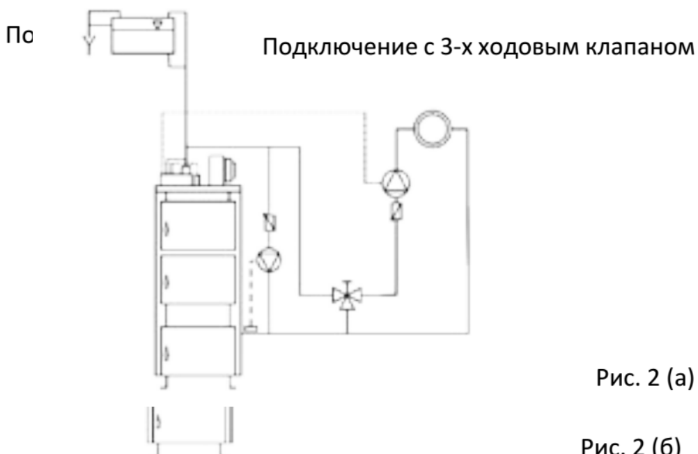
Рис. 2 (а)

Для правильной долгой и безаварийной эксплуатации котла следует установить трех- или четырехходовой клапан для повышения температуры обратной воды в котле и контроля теплоносителя в системе отопления, что поможет избежать процесса конденсатообразования и сжижения смолы в камере сгорания. Это позволит уменьшить затраты на приобретение топлива, продлить срок службы котла и повысить его эффективность, так как смола в данном случае выступает в качестве изолятора и уменьшает теплоотдачу. Наиболее эффективным является использование котла при его номинальной мощности и температуре теплоносителя не ниже 60 град С. Применение смесительного клапана приводит в свою очередь к снижению потребления топлива, облегчает эксплуатацию и, безусловно, продлевает ресурс работы котла. Котел должен подключаться к независимому дымоходу (кирпичному с вкладышем из нержавеющей стали или двустенному приставному). Диаметр дымохода должен быть не менее диаметра дымоотводящего патрубка котла. Это обеспечит безопасную и стабильную работу котлоагрегата. Труба на котел должна одеваться плотно и жестко, чтобы предотвратить неконтролируемый выход дымовых газов . Все части дымового канала должны быть выполнены из нержавеющей коррозионностойкой стали. Подключение к дымоходу должно соответствовать действующим правилам и выполняться уполномоченным лицом (организацией). Проверить правильность схемы