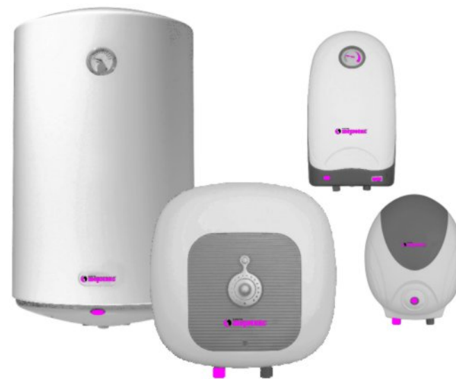
Рис.1. Внешний вид ЭВН

Водонагреватель оборудован штатным сетевым шнуром электропитания с вилкой. Электрическая розетка должна иметь контакт заземления с подведенным к нему проводом заземления и располагаться в месте, защищенном от влаги, или удовлетворять требованиям по влаго- и брызгозащищенности.